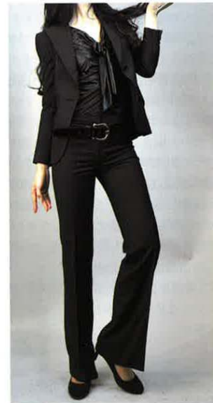
生地は1000以上からチョイス可能で、インナーからスカートまで提案している

か月程度です。各スタッフの方を採寸し、納品させて頂きますが、採寸時から体型が変わってしまったような場合はサイズ調整させて頂きますし、事後のリフォームなども可能な設計になっています。